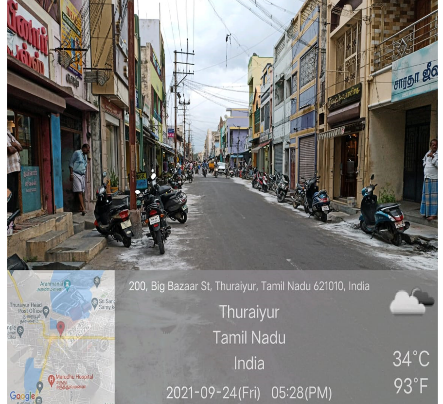
சுத்தம் செய்ததற்கு பின்பு