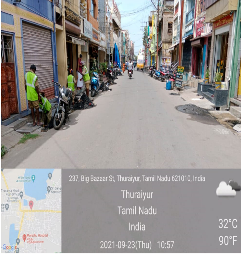
சுத்தம் செய்வதற்கு முன்பு