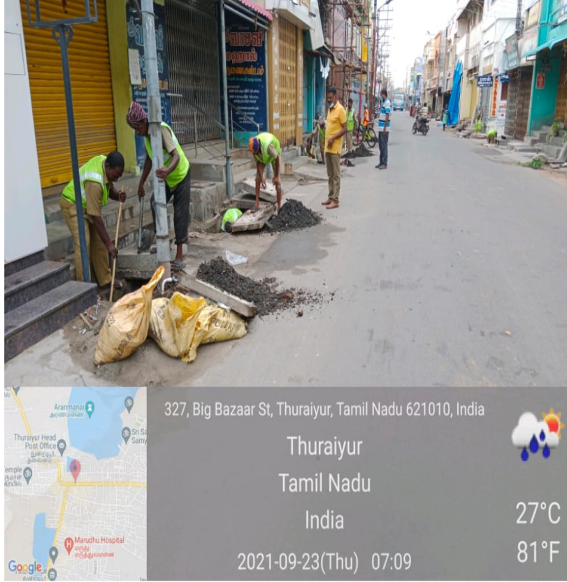
சுத்தம் செய்வதற்கு முன்பு