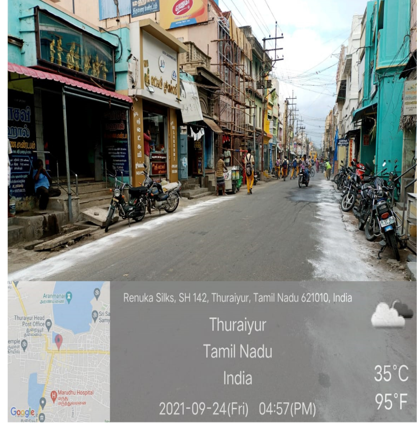
சுத்தம் செய்ததற்கு பின்பு