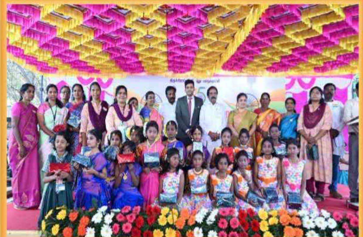
26.01.2024 அன்று நடைபெற்ற குடியரசு தின விழா கொண்டாட்டம்