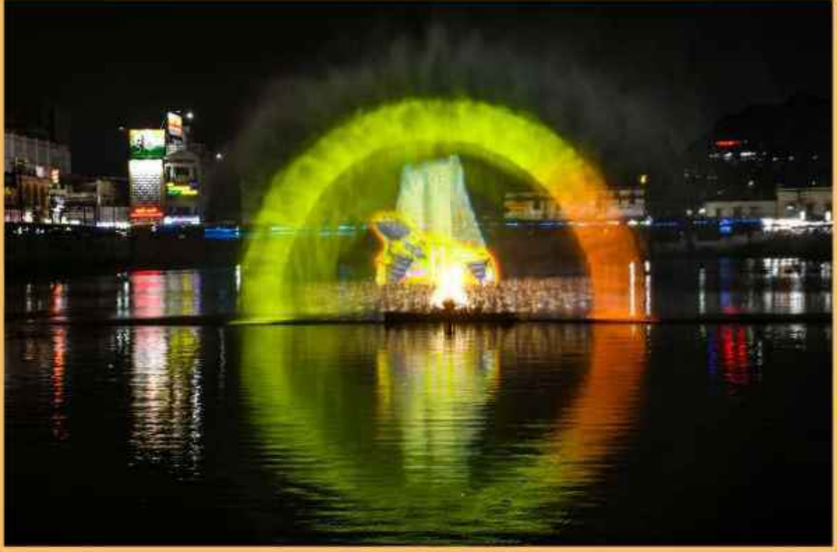
மலைக்கோட்டை தெப்பக்குளத்தில் ஒலி ஒளி நிகழ்ச்சி