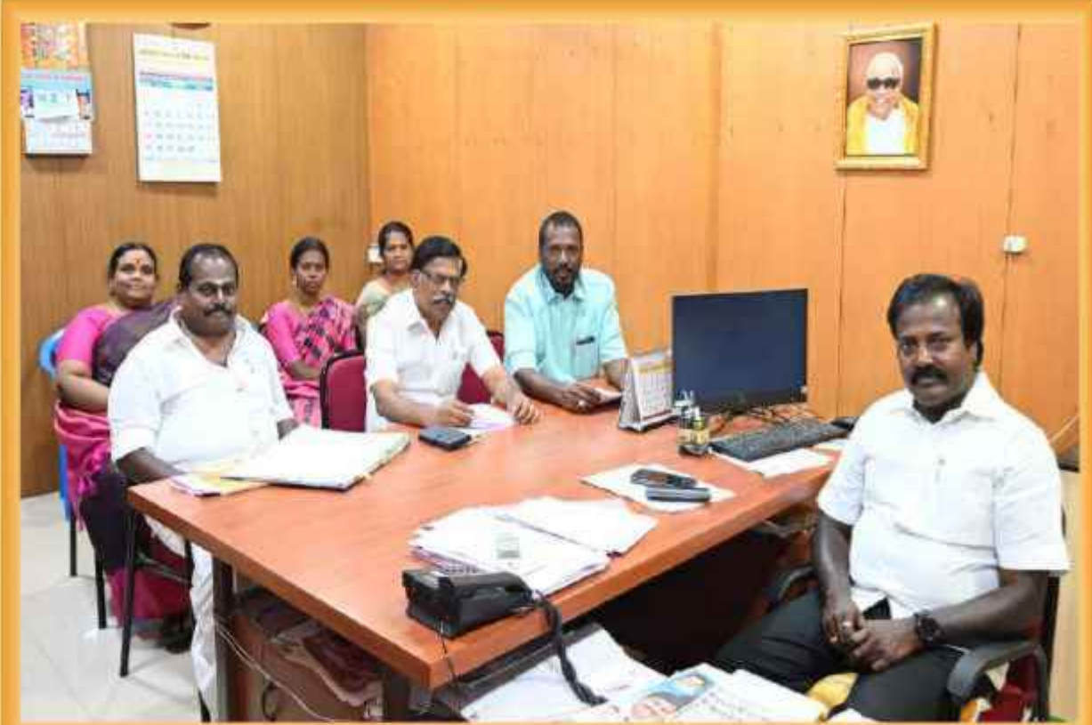
வரவு செலவு அறிக்கை குறித்து நிதிக்குழு விவாதம்