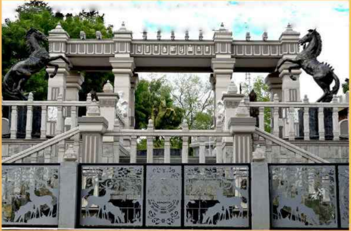
பட்டர் வெர்த் சாலை புராதன பூங்கா முகப்பு