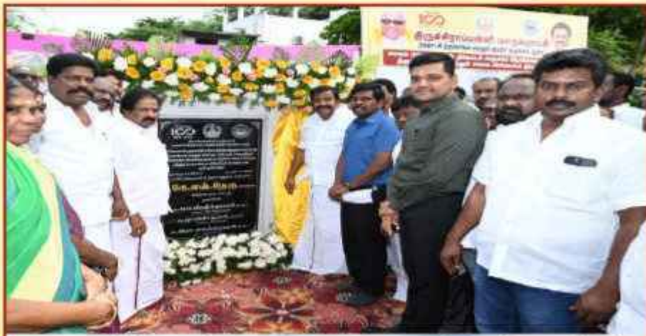
மாரீஸ் மேம்பாலம் புதிதாக கட்டப்படும் போது

இதனைத் தொடர்ந்து, இப்பணிக்கு ஒப்பந்தப்புள்ளி அறிக்கை எண். 579/2022- 23 நாள்.05.04.2023 வாயிலாக ஒப்பந்தப்புள்ளிகள் கோரப்பட்டு, ஒப்பந்தக்காரருக்கு 28.07.2023 அன்று பணி உத்தரவு வழங்கப்பட்டு, பணிகள் தற்பொழுது நடைபெற்று வருகிறது.