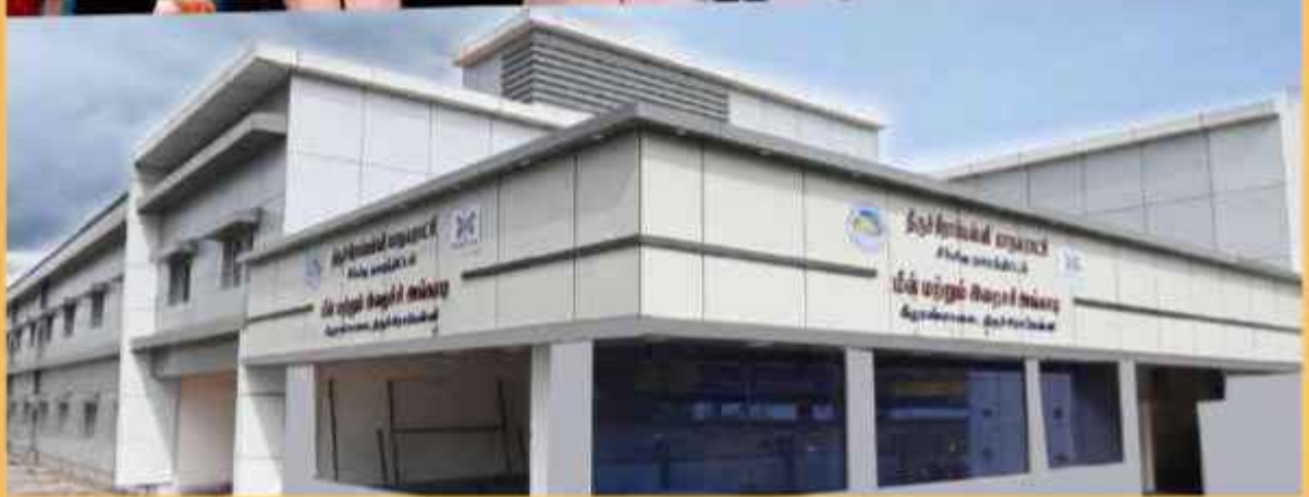
காந்தி சந்தையில் சீர்மிகு நகரத் திட்டத்தின் கீழ் கட்டப்பட்ட மீன் மற்றும் இறைச்சி அங்காடி திறந்து வைக்கப்பட்டது