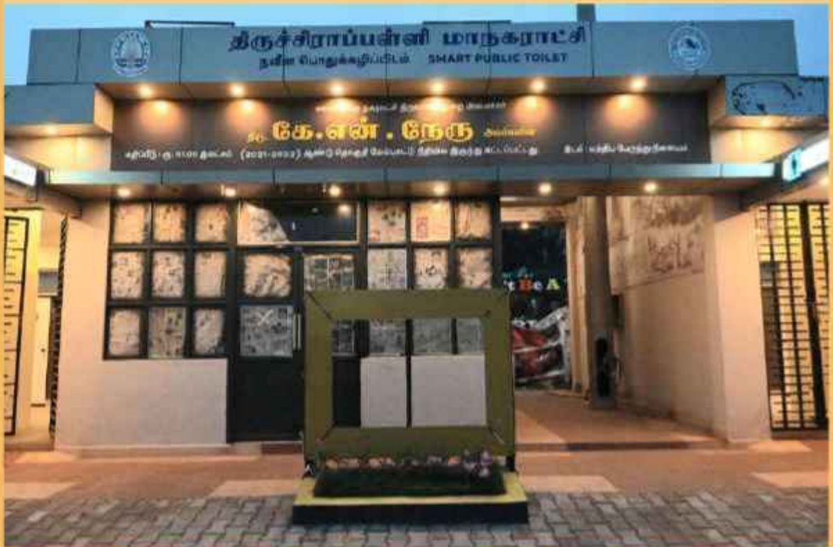
மத்திய பேருந்து நிலைய நவீன பொதுக் கழிப்பிட முகப்பு